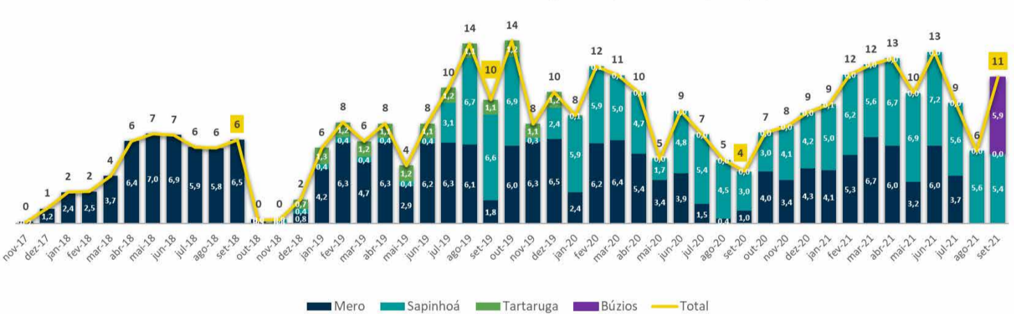
Excedente em Óleo da União Médio Diário por Campo dos CPPs (Mil bpd)

A média diária do total do excedente em óleo da União nos quatro contratos de partilha de produção foi de 11,3 mil bpd , sendo 5,9 mil bpd referente ao Campo de Búzios e 5,4 mil bpd referente ao contrato do Entorno de Sapinhoá. Na Área de Desenvolvimento de Mero não houve produção devido à parada programada de transição para o SPA-2, e em Tartaruga Verde Sudoeste o excedente em óleo da União foi destinado à quitação do Acerto de Contas com o operador oriundo da redeterminação do AIP. No geral, houve um aumento de 83% em relação ao mês anterior por conta da entrada do campo de Búzios gerando volume de excedente em óleo da União no contrato de partilha de produção.